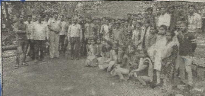
गुहागर तालुक्यातील चिखली जैवविविधता उद्यानात विद्यार्थ्यांना मार्गदर्शन करताना मान्यवर सोबत प्राध्यापक.