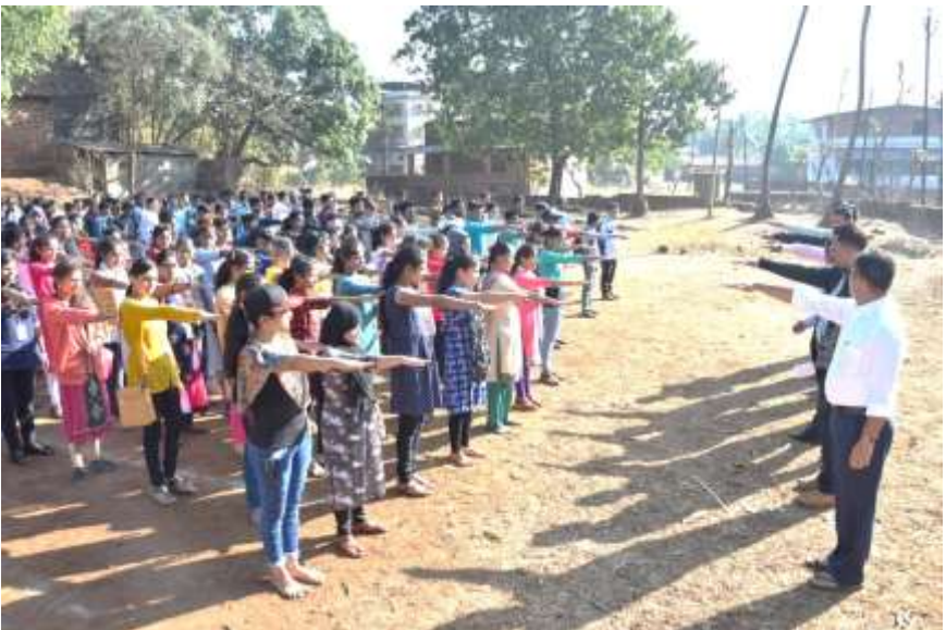
(Students taking Voters Oath)